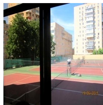
Участок по ул. Средне-Московская, 66 ДЮСШ № 1 не оформлен

В нарушение Федерального закона «О некоммерческих организациях» договоры аренды, заключенные 5-ю школами, учредителем не согласованы. Это стало возможным в отсутствие в городском округе утвержденного Порядка предварительного согласования совершения бюджетным учреждением крупных сделок. Помимо этого, руководством СДЮСШОР № 13 в нарушение всех существующих норм и правил самовольно возведена пристройка к зданию, которая сдавалась в аренду, игнорируя нормы действующего законодательства. Незаконно возведенные здания и сооружения расположены и на территории СК «Олимпик» (СДЮСШОР № 12).