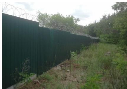
Частное имущество на территории муниципальных лагерей

4.3.9. По результатам проверки имущественных комплексов семи действующих и девяти недействующих детских оздоровительных лагерей, входящих в состав МАУ «Центр детского отдыха «Перемена», выявлены многочисленные, копившиеся годами, нарушения в области земельных и имущественных отношений, связанные с отсутствием в учреждении соответствующих специалистов. В частности, не зарегистрировано право постоянного (бессрочного) пользования на земельный участок, занимаемый