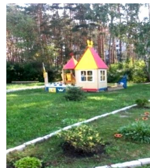
Новые объекты не числятся в учете

4.3.4. Практически во всех учреждениях образования (кроме МКУ «Центр развития образования») выявлены нарушения и недостатки при использовании и распоряжении имуществом. Например, в бухгалтерском учете детских садов № 36, 111, 166 не отражено вновь построенное имущество. Детским садам № 36, 166 управлением имущественных и земельных отношений передано имущество без указания балансовой стоимости. Часть имущества детского сада № 118, принятого управлением имущественных и земельных отношений от Минобороны России, учреждению до настоящего времени не передано, на часть сооружений годами не регистрировалось право оперативного управления.