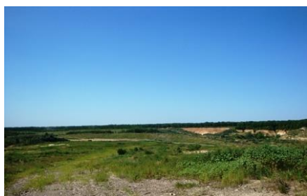
Полигон ТБО подлежит рекультивации

Администрацией принято решение о нецелесообразности дальнейшей деятельности предприятия в существующем формате, рассматривается вопрос о его присоединении к МКП «Воронежтеплосеть».