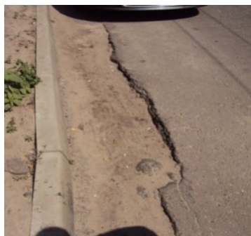
После установки бортовых камней на бульваре Победы не восстановлено асфальтобетонное покрытие

Более чем на 30 объектах УДС выявлены факты некачественного выполнения работ: