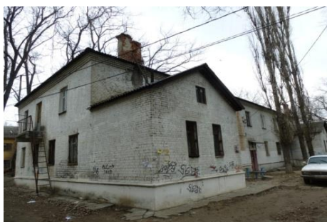
Передача в муниципальную собственность общежития по ул. Мостостроителей, 3 повлекла дополнительные расходы бюджета

поскольку именно количество обслуживаемых объектов определяет потребность в объеме субсидий.