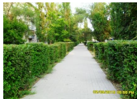
Объем работ по стрижке кустарников в пер. Ольховый завышен на 1 116 м 2

При проверке работ по озеленению территории города управами районов Палата обратила особое внимание на различные подходы к определению объемов, видов и стоимости работ, а также периодичности их проведения. Это стало одной из основных причин неэффективных расходов, которые в стоимостной оценке составили более 600 тыс. руб. В том числе случаи завышения объемов работ, оплаты работ при отсутствии подтверждающих документов, необоснованного применения расценок и т.д.