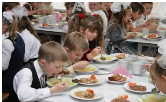
Выявлены случаи переплаты поставщикам за организацию школьного питания

4.3.7. В ходе проверки организации горячего питания в общеобразовательных школах выявлено нарушение требований ст. 34 Федерального закона № 44-ФЗ. Победители торгов предлагали снижение начальной цены контракта, соответственно, стоимость одного завтрака и одного обеда должна была