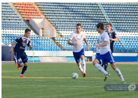
Конкретные цели и задачи предоставления субсидий спортивным клубам в МП не установлены

Проверка показала, что за проверяемый период из городского бюджета этим спортивным клубам выделено 482 млн. руб., что сопоставимо с годовым содержанием 25-ти муниципальных детских спортивных школ. Надо отметить, что ФК Факел с 2014 года субсидий из бюджета города не получает. Поддержка профессиональных клубов за счет бюджета Воронежской области за аналогичный период составила 663 млн. руб.