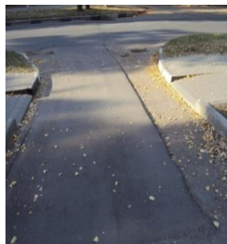
На бульваре Пионеров уровень асфальта на 3-5 см выше ранее уложенного

– в Железнодорожном и Коминтерновском районах после укладки бортовых камней подрядчиками не восстанавливались асфальтобетонное покрытие и газоны;