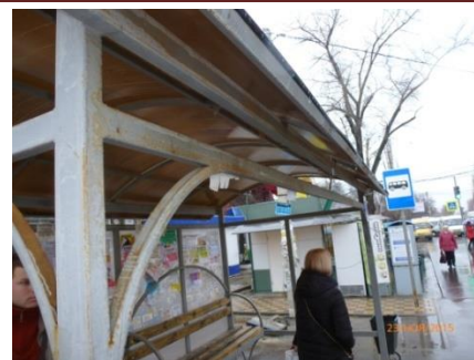
Остановочный павильон на ж/д станции Машмет находится в неудовлетворительном состоянии

Допущены учреждением и нарушения законодательства о закупках: несвоевременно размещалась информация об исполнении контрактов в ЕИС, в контрактах отсутствовали такие существенные условия, как сроки оплаты выполненных работ, характеристики используемых материалов. Последний, казалось бы, мелкий недочет, привел к тому, что в результате отсутствия требований к материалам, из которых изготовлены остановочные павильоны, все объекты за год покрылись коррозией, требуют ремонта, а значит - новых расходов бюджета.