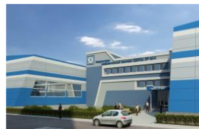
ПСД на строительство ФОК СДЮСШОР № 14 так и осталась невостребованной

По результатам контрольных мероприятий, как в управлении строительной политики, так и непосредственно на объектах проверок, КСП отмечает, что при наличии «долгостроев» в ГАИП продолжают включаться новые объекты, расходуются бюджетные средства на разработку проектно-сметной документации. Практика нерационального планирования приводит к неэффективному расходованию бюджетных средств. Так, в период с 2006 по 2012 годы выполнены проектные работы на объекты, строительство которых не финансировалось (реконструкция стадиона «Чайка», ФОК СДЮСШОР № 14, строительство КНС и станции водоподготовки в г.м. Масловка и др.). Разработанная за бюджетные средства проектная документация не востребована, 61,3 млн. руб. израсходованы без достижения утвержденных программой целей.