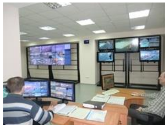
МП «Обеспечение общественного порядка» доработана по рекомендации КСП

Вместе с тем очевидно, что установленных видеокамер явно недостаточно, а организация видеонаблюдения и интеграция в единую систему уже установленных видеокамер становится жизненно необходимой, особенно в условиях увеличения преступности на территории города. Принимая во внимание дефицитный городской бюджет и отсутствие свободных бюджетных ресурсов, КСП еще раз отмечает, что без привлечения внебюджетных источников обеспечить город эффективной системой видеонаблюдения невозможно.