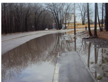
Уклон участка проезжей части на ул. Ломоносова

В адрес администрации города направлено предложение о разработке единого порядка работы заказчиков по гарантийному ремонту УДС, предусматривающего ведение реестра гарантийных обязательств и установление дополнительной ответственности подрядчиков и должностных лиц, участвующих в приемке работ. Кроме того, в целях исключения дублирования зон ответственности и повторного ремонта одних и тех же участков, управлению дорожного хозяйства рекомендовано разграничить полномочия по капитальному и аварийно-восстановительному ремонту автомобильных дорог между городскими управами и МКУ «ГДДХиБ».