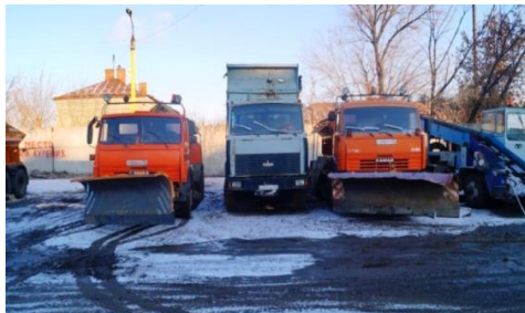
Спецтехника привлеклась у организаций, которые не имеют собственного автопарка

собственности по Федеральному закону № 223-ФЗ «О закупках товаров, работ, услуг отдельными видами юридических лиц». Проверка комбинатов благоустройства показала, что существуют пробелы Федерального закона № 223-ФЗ, которые создают предпосылки для злоупотребления правом и часто приводят к необоснованному выбору поставщиков и к неэффективным расходам.