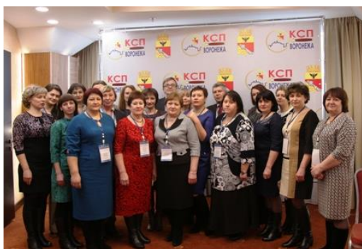
Участники конференции из муниципалитетов

Практическую пользу конференции отметили руководители органов внутреннего и внешнего финансового контроля муниципальных районов и городов Воронежской области.