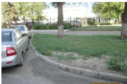
На Ленинском проспекте восстановлено а/б покрытие и бортовой камень

– на 4 объектах (Ленинский проспект, ул. Урицкого, ул. Вл. Невского и ул. 9 Января) уровень нового асфальта не совпадал с уровнем ранее уложенного покрытия;