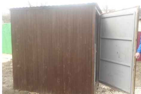
Вместо антивандального контейнера в сквере «Чайка» установлена сварная конструкция

Установлено, что в заказах учредителя для МКП «ЭкоЦентр» отсутствовало экономическое обоснование объемов и видов работ на сумму 18,7 млн. руб., предприятию доводились заказы на реконструкцию парков и скверов, выполнить которые собственными силами оно заведомо не могло. Получив в свое распоряжение значительный объем бюджетных средств,