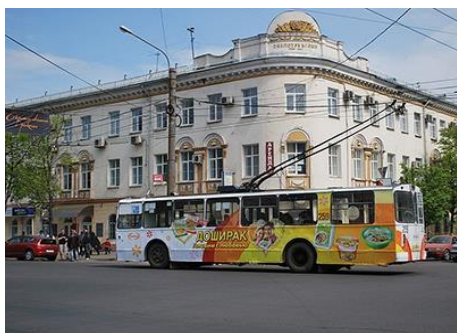
Муниципальный заказ на 5 маршрутах МКП не исполнен

Проверка показала, что за счет бюджетных средств на условиях софинансирования в 2013-2015 годы обновлен подвижной состав – приобретено и передано МКП МТК «Воронежпассажиртранс» 77 единиц автотранспорта. Новый транспорт вышел и на коммерческие маршруты – за счет средств частных перевозчиков приобретено 238 автобусов на общую сумму 453 120 тыс. руб. По итогам 2015 года индикатор «уровень обеспеченности подвижным составом пассажирского транспорта» достиг установленного подпрограммой значения (68,8%). С 2015 года предоставление права на