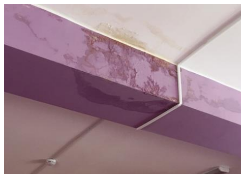
Помещения МБДОУ «Детский сад № 138» после проведения ремонта

В ходе проверок капремонтов отмечен низкий уровень подготовки проектно-сметной документации. Зачастую это происходит потому, что составление заданий на изготовление проектно-сметной документации, дефектных ведомостей, а также технический надзор за проведением работ по капитальному ремонту осуществляются сотрудниками школ, детских садов,