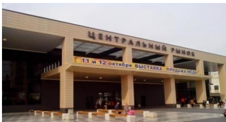
Строительный контроль ДЕЗ КС осуществлялся на объектах, не включенных в ГАИП

По результатам контрольного мероприятия решением Воронежской городской Думы утверждены изменения в Положение об Избирательной комиссии, имущество внесено в реестр муниципальной собственности, разработан Порядок оформления гражданско-правовых договоров.